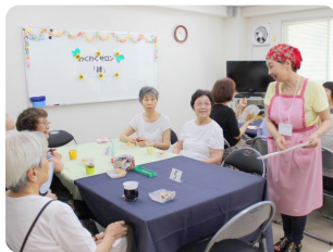
サロンでの楽しいひととき